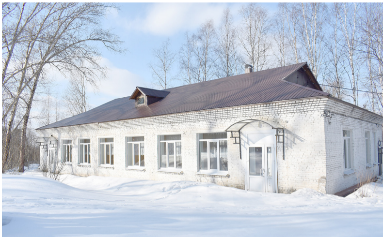
Центр социального обслуживания «Детский сад для пожилых»