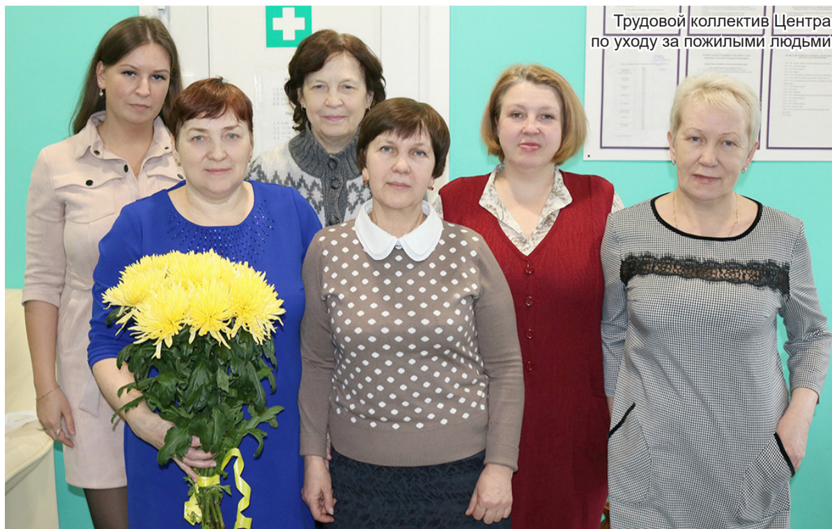
Трудовой коллектив Центра по уходу за пожилыми людьми