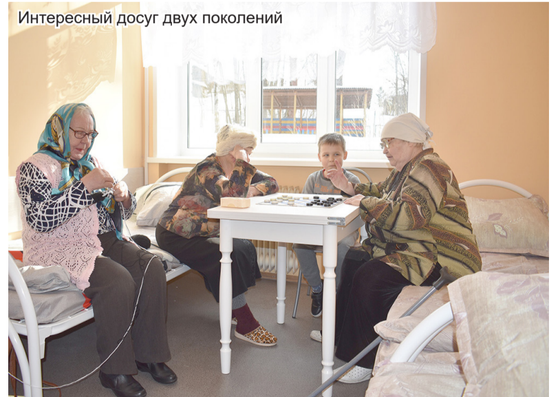
Интересный досуг двух поколений

Добавим, что Центр, хотя и пользуется поддержкой государ-